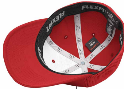
Ruban ATC MC sur les coutures intérieures